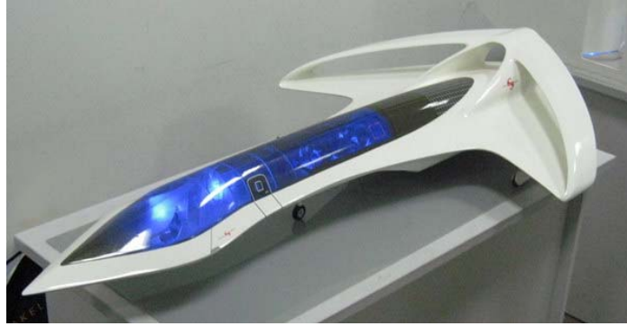
Рис. 4. Что нас может ждать в будущем в этой сфере