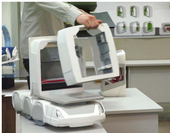
Рис. 2. Как это было раньше и как происходит сейчас