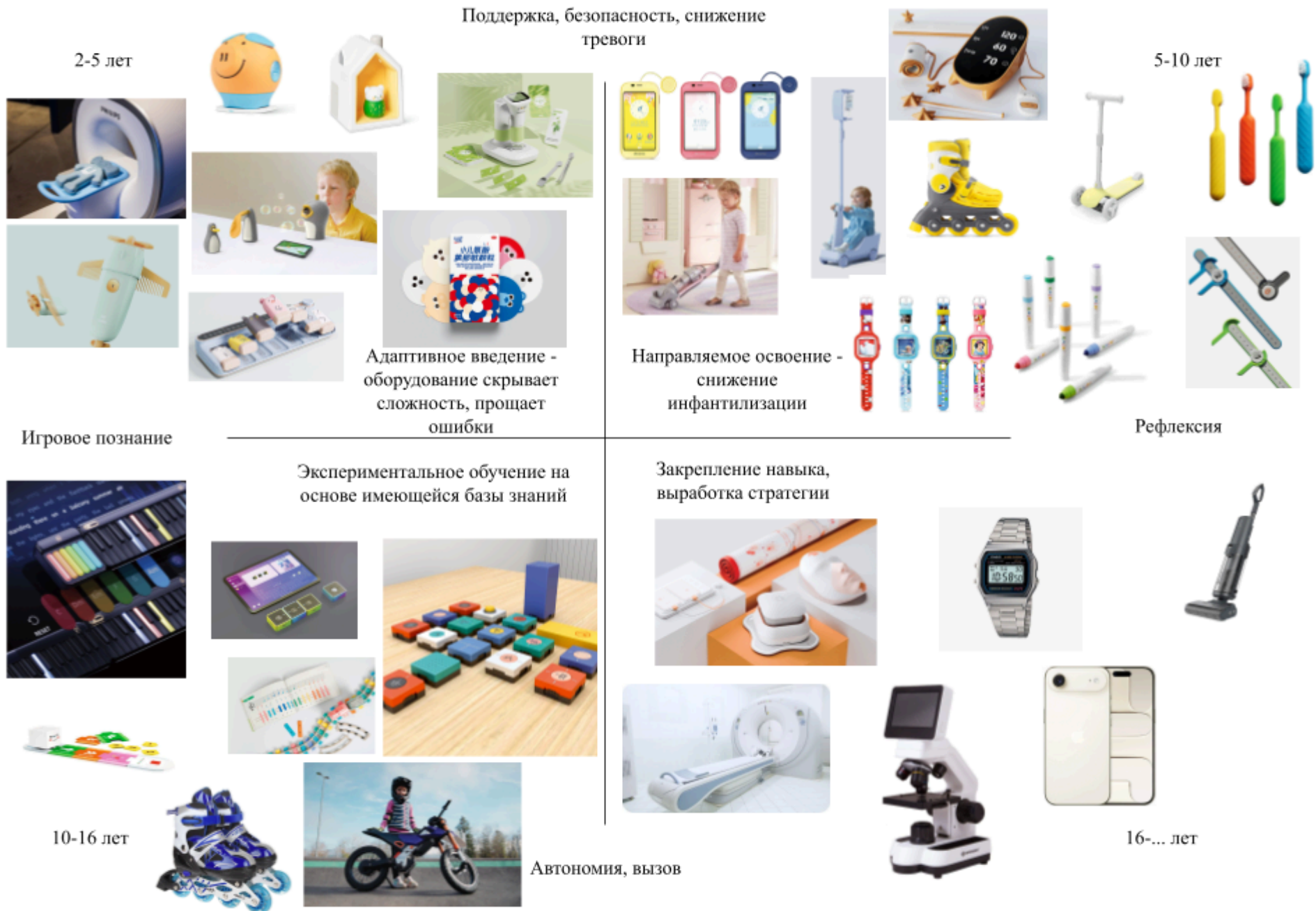
Рис. 1. Компас образов (означающего) для объектов дизайна для разных возрастных групп