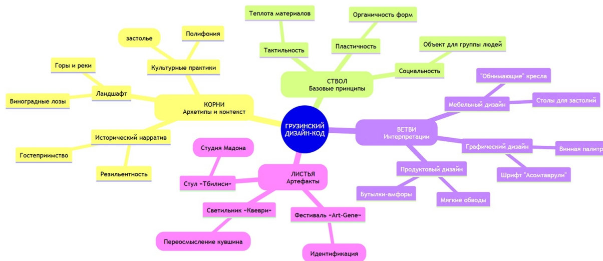
Рисунок 1 – Структурная модель анализа грузинского дизайна

Среди наиболее значимых фигур грузинского промышленного дизайна следует выделить Гочу Картвели, чьи автомобильные концепты отличаются экспрессивной пластикой, и студию «Мадона», специализирующуюся на мебели и интерьерах. Отдельного внимания заслуживают молодые авторы, работающие в рамках направления «новый грузинский винтаж», которое представляет собой синтез ретроспективных референсов и современных технологических решений. Обобщающая структурная модель, систематизирующая выявленные принципы грузинского дизайна, представлена на рис. 1.