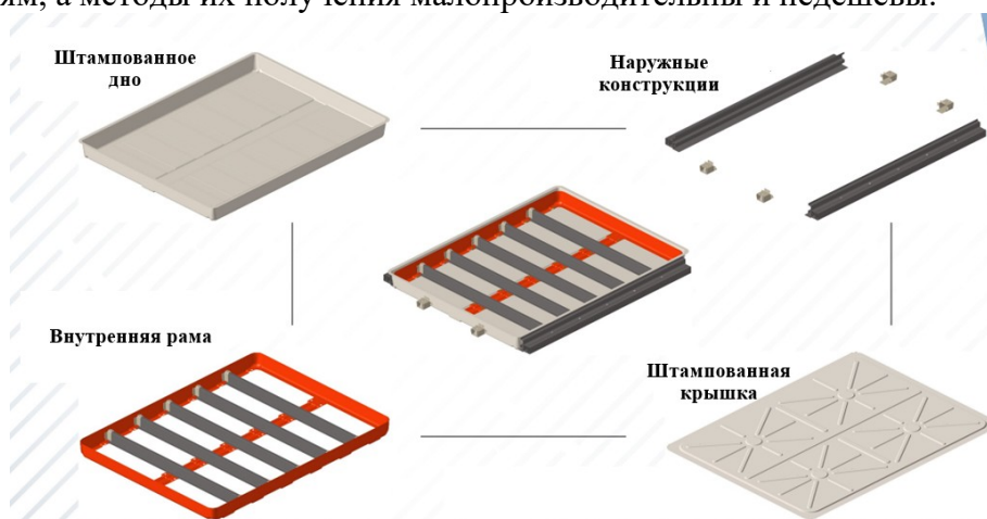
Рисунок 1 - новые корпуса батарей электромобилей

Создание новых, более легких, но при этом прочных корпусов для батарей – рисунок 1 [3], кузовов автомобилей – наиболее рациональное направление развития. Но большинство распространенных сегодня профилей не соответствуют необходимым требованиям, а методы их получения малопродуктивны и недешевы.