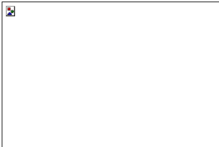
Рис. 1. Схема «сэндвич» структуры перовскитного ФЭП.

Несколько лет назад в «солнечную гонку» вступил новый игрок — перовскитные солнечные батареи.