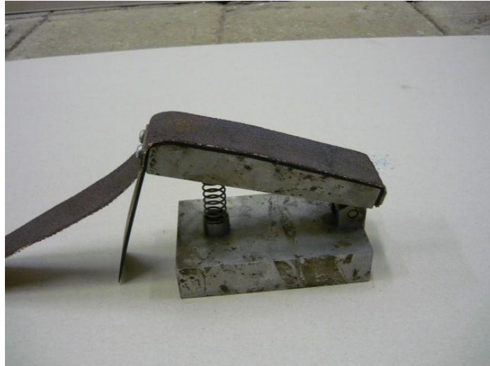
Рис.1. Опытный образец абразивно-режущей секции.