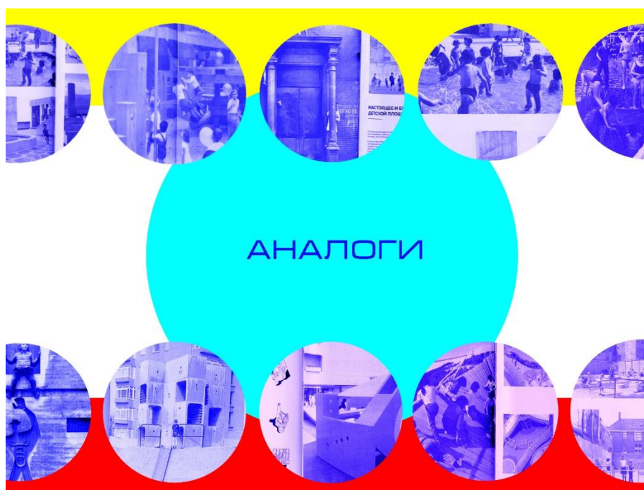
Рис. 3 Аналогии.

Оптимальным вариантом являются универсальные детские спортивные и игровые площадки, разделенные на специфические игровые, спортивные и парковые зоны. Правильное деление комплекса на территории в соответствии с возрастом детей, которые будут конечными пользователями площадки, является одной из важнейших целей. Согласно действующим нормам, каждая детская площадка должна иметь паспорт безопасности (ГОСТ 2.601).