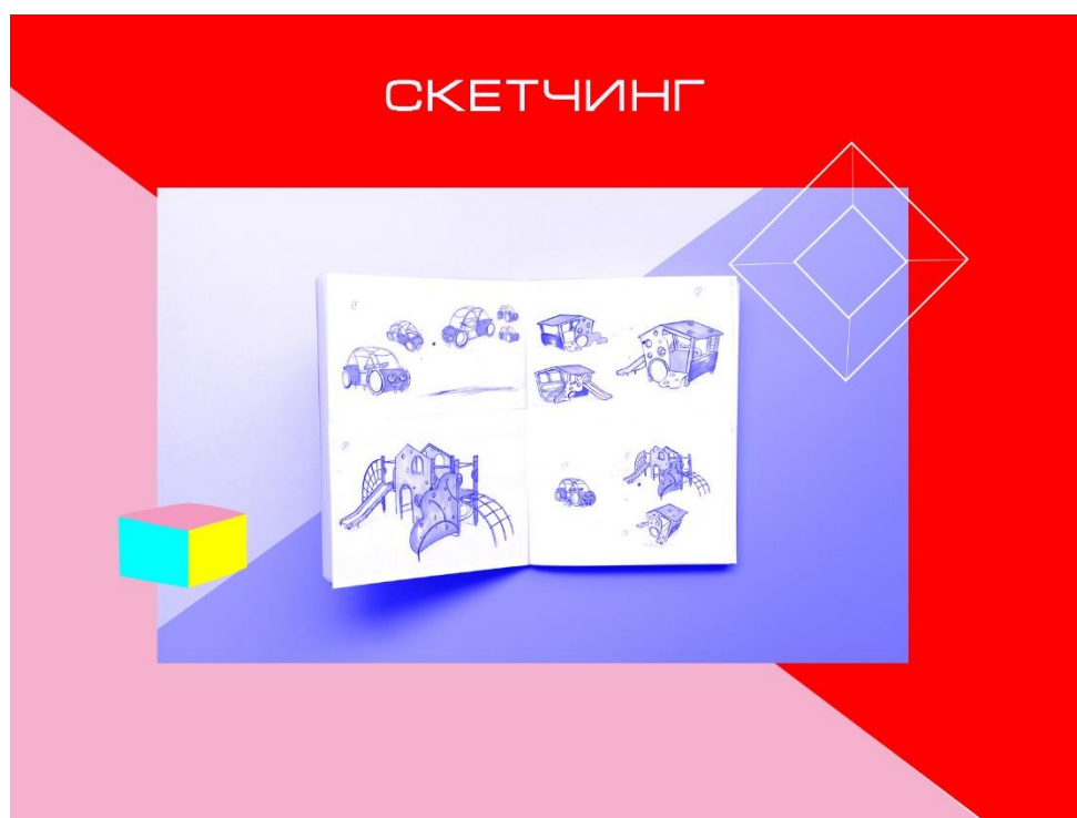
Рис. 4 Скетчинг.

Оборудование детской площадки соответствует возрасту, весу, росту и физическим возможностям ребенка. Материалы для строительства участка должны быть экологически чистыми и безопасными для использования, такими как: дерево, оргстекло (толстое), краска для дерева, резиновое покрытие и металл. Дерево обладает высокой экологичностью, прекрасными декоративными качествами и хорошо сочетается с любым природным ландшафтом. Древесина используется для изготовления скамеек-декоративных элементов участка. Оргстекло-это акриловый листовый материал, он обладает такими положительными качествами, как: ударопрочность, малый вес и может быть отлит в любую форму. Оргстекло используется для центрального шара площадки. Дети, спускаясь с горки в песочнице к мячу, могут рисовать на нём специальными маркерами, после чего рисунки легко удаляются с поверхности стекла. Чтобы оно не ломалось под тяжестью деревянной конструкции, делается металлический каркас, который удерживает дерево. Каждая деревянная деталь на участке должна быть отшлифована и покрыта органическими красителями. Краска должна быть устойчива к воздействию света и температуры. Выбор покрытия также очень важен. Прорезиненная поверхность пены идеально подходит для детской площадки