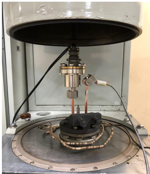
Рисунок 1 – Откачной пост с экспериментальным оборудованием

В данной работе разобран метод косвенной оценки давления во внутреннем объеме СВЧ приборов по средствам НЭМ (насос электроразрядный магнитный). НЭМ – это устройство, предназначенное для обезгаживания объема прибора после отделения от откачного поста и до завершения всех последующих технологических операций. Метод косвенной оценки служит для приблизительного измерения давления, полученного в изделии. Для построения данной методики провели ряд экспериментов, которые заключаются в следующем. На откачном посту закрепили высоковакуумный датчик и НЭМ (рисунок 1). Далее к НЭМ подключили цепь амперметров с разной чувствительностью, а именно: миллиамперметр, микроамперметр, наноамперметр. После чего начали параллельно фиксировать показания с амперметров и вакуумметра. В диапазоне шкалы миллиамперметра шаг фиксирования составил 1мА, в диапазоне шкалы микроамперметра шаг фиксирования составил 10мкА, а в диапазоне шкалы наноамперметра шаг составил 100 нА для повышения точности измерения при низких давлениях.