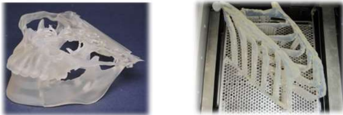
Рис. 2. Пластиковые медицинские прототипы, выращенные на установке лазерной стереолитографии.

некоторое время проходит процедуру дополимеризации в специальной камере. Таким образом, получается прототип, готовый к эксплуатации. На рисунке 2 показаны выращенные медицинские прототипы. [1], [2]