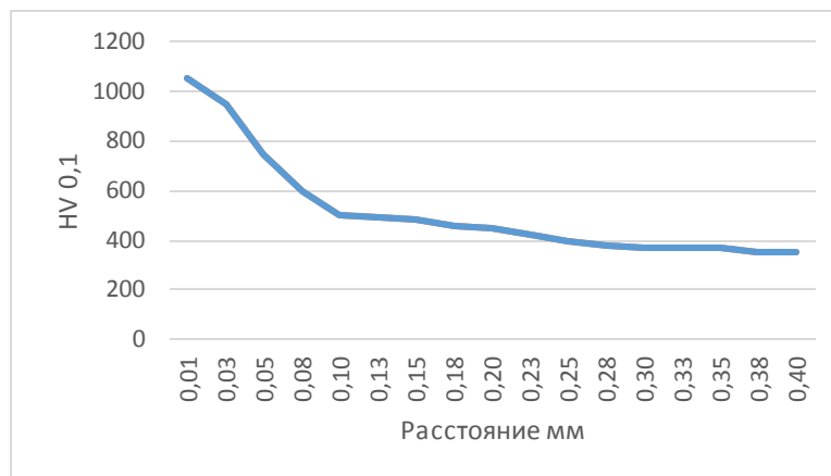
Рис 2. Распределение твердости азотированного слоя по глубине

Закаленный цементованный слой служит подложкой для последующего азотирования.