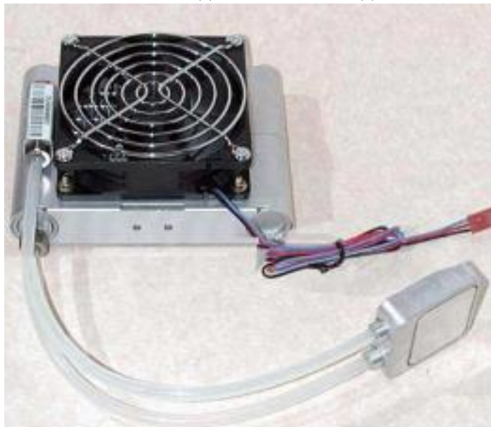
Рис.1 Жидкостной испаритель

Первые СВО были прерогативой любителей, с использованием в конструкции автомобильных радиаторов, аквариумных помп, самодельных ватерблоков и резервуаров. До сих пор такой подход к водяному охлаждению продолжает существовать и активно обсуждаться на специализированных форумах. Тем не менее, вот уже несколько лет производятся серийные решения в области жидкостного охлаждения компьютеров (рис. 1).