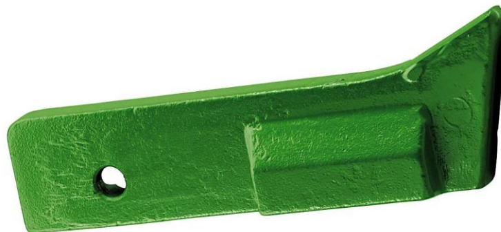
Рис. 1. Долото сеялки Primera DMC 9000

Износ рабочих долот является общей проблемой для всех современных почвообрабатывающих и посевных машин. В настоящее время долото является самым распространенным типом рабочего органа данных машин с анкерными и дисковыми сошниками. В процессе эксплуатации долота подвергаются интенсивному износу, при этом определяющим следствием износа является не столько увеличение тягового сопротивления и соответствующее увеличение расхода топлива, сколько ухудшение качества заделки семян и, как следствие, снижение урожайности. Несмотря на то, что конструкция сменного долота достаточно проста, замена комплекта долот, например для сеялки DMC 9000 с 48 долотами, обходится не дешево (ориентировочно 4500 - 5000 €). Учитывая реализованное производителем количество сеялок в России, особенности их эксплуатации, значительную (до 10000 га) сезонную наработку на один почвообрабатывающий агрегат и стоимость обслуживания, вопрос долговечности долот сошника сеялки DMC 9000 является актуальным.